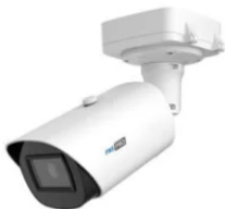
PNS-PRO 5261 LPR