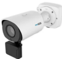
PNS-PRO 5265 LPR TS