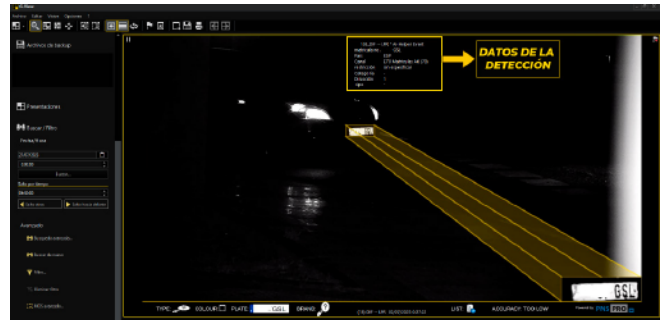
Detección de matrícula de noche

Lecturas de matrículas hasta 200km/h de velocidad del vehículo