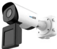
PNS-PRO 5263 LPR TS