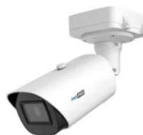
PNS-PRO 5288 IA