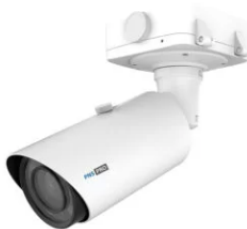
PNS-PRO 5262 LPR